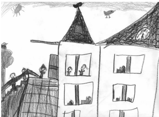
„Spielen in der OGS“ von Kim Lara

Andere Kinder können gegen einen Kostenbeitrag ebenfalls an den Ferienangeboten teilnehmen. (Bitte jeweils nachfragen!)