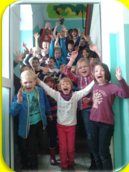
Das sind wir - die OGS-Kinder